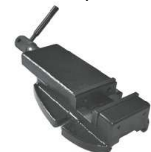
Etau EP 100 BF