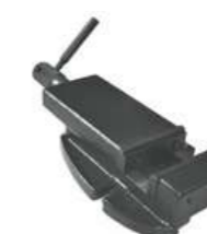
Etau EP 100 BF